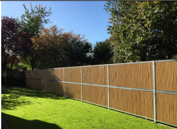
Voorkant en achterkant scherm