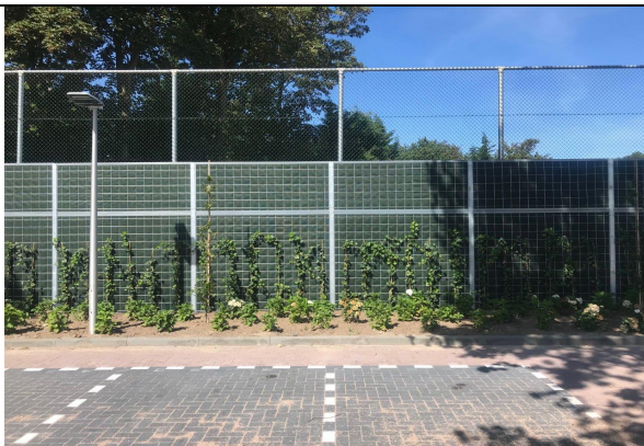
Voorkant en achterkant scherm